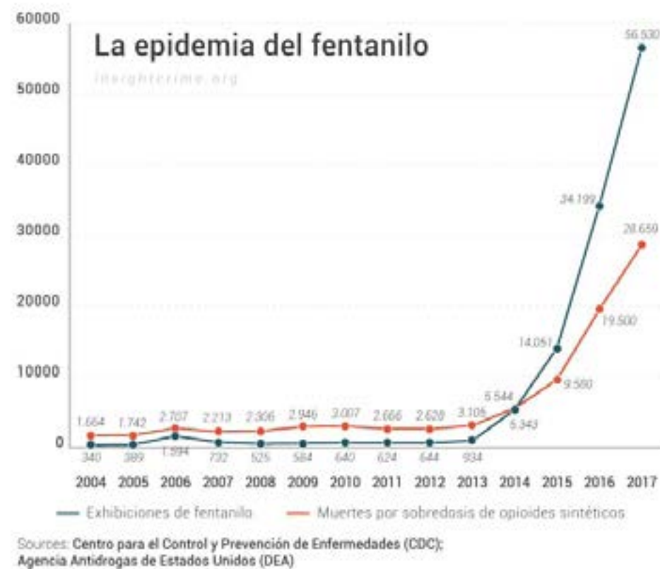
Gráfico 3. Crecimiento en el uso del fentanilo en EE. UU.